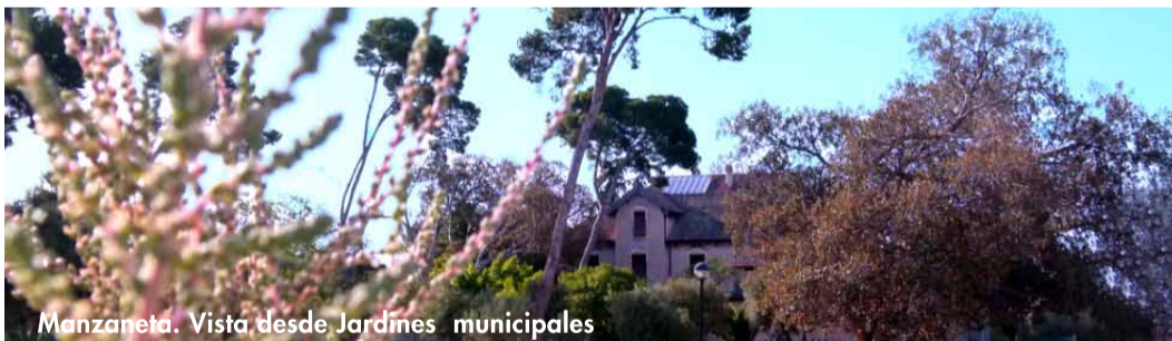
Manzaneta. Vista desde Jardines municipales

Descobrir Sant Joan d'Alacant és deixar-se seduir per una terra plena d'història. Des de temps immemorials esta fèrtil comarca s'ha dedicat a l'activitat agrària. Durant els segles XVI, XVII i XVIII la nostra prosperitat va afavorir la construcció d'importants cases de llauradors típiques de l'horta al costat d'una impressionant xarxa de sendes, sèquies i un conjunt de torres defensives conegudes com les "Torres de l'Horta". En el segle XIX, aristòcrates i burgesos de la capital alacantina van construir les millors finques com a signe de poder i riquesa, buscant la pau i delit als camps d'Alacant, donant origen al que hui anomenem "estiuieg". Si vols saber que va animar als nobles a gaudir ací dels seus dies de descans, endinsa't en el nostre poble i descobreix el meravellós llegat que hem atesorat al llarg dels segles.