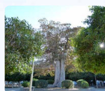
Pl. Josep Carreras