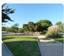
Parque Lo Pagán