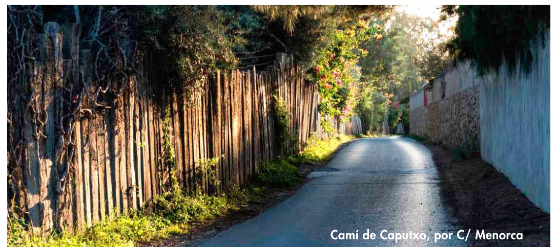
Camí de Caputxo, por C/ Menorca