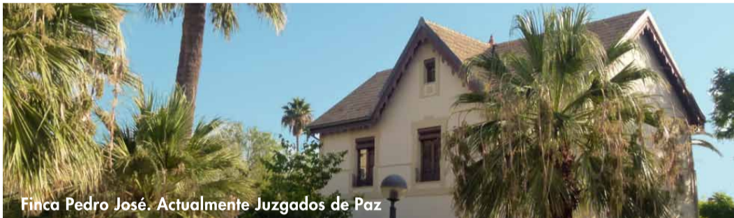
Finca Pedro José. Actualmente Juzgados de Paz

Descubrir Sant Joan d'Alacant es dejarse seducir por una tierra llena de historia. Desde tiempos inmemoriales esta fértil comarca se ha dedicado a la actividad agraria. Durante los siglos XVI, XVII y XVIII nuestra prosperidad favoreció la construcción de importantes casas de labranza típicas de la Huerta, junto a una impresionante red de senderos, acequias y un conjunto de torres defensivas conocido como "Las Torres de la Huerta". En el siglo XIX, aristócratas y burgueses de la capital alicantina construyeron las mejores fincas como signo de poder y riqueza, buscando la paz y deleite en los campos de Alicante, dando origen a lo que hoy llamamos "veraneo". Si quieres saber qué empujó a los nobles a disfrutar aquí de sus días de asueto, adéntrate en nuestro pueblo y descubre el maravilloso legado que hemos atesorado a lo largo de los siglos.