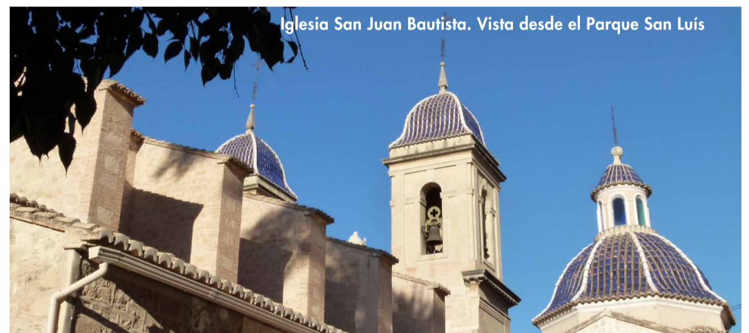
Iglesia San Juan Bautista. Vista desde el Parque San Luís