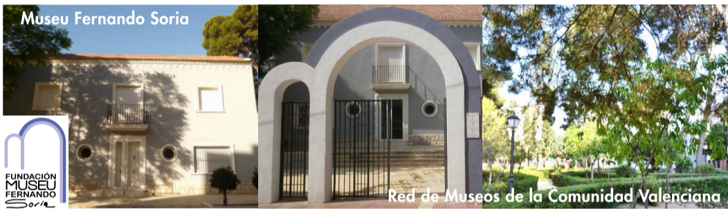
Museu Fernando Soria

Descubrir Sant Joan d'Alacant es dejarse seducir por una tierra llena de historia. Desde tiempos inmemoriales esta fértil comarca se ha dedicado a la actividad agraria. Durante los siglos XVI, XVII y XVIII nuestra prosperidad favoreció la construcción de importantes casas de labranza típicas de la Huerta, junto a una impresionante red de senderos, acequias y un conjunto de torres defensivas conocido como "Las Torres de la Huerta". En el siglo XIX, aristócratas y burgueses de la capital alicantina construyeron las mejores fincas como signo de poder y riqueza, buscando la paz y deleite en los campos de Alicante, dando origen a lo que hoy llamamos "veraneo". Si quieres saber qué empujó a los nobles a disfrutar aquí de sus días de asueto, adéntrate en nuestro pueblo y descubre el maravilloso legado que hemos atesorado a lo largo de los siglos.