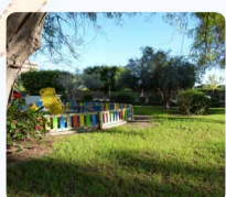
Parque Dr. Rico