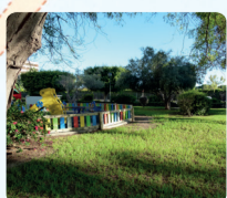
Parque Dr. Rico