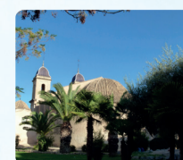
Parque San Luis