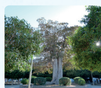
Plza. Josep Carreras