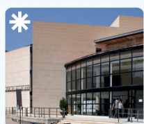
Casa de Cultura