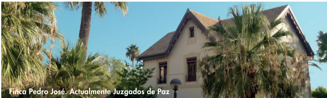
Finca Pedro José. Actualmente Juzgados de Paz

Descubrir Sant Joan d'Alacant es dejarse seducir por una tierra llena de historia. Desde tiempos inmemoriales esta fértil comarca se ha dedicado a la actividad agraria. Durante los siglos XVI, XVII y XVIII nuestra prosperidad favoreció la construcción de importantes casas de labranza típicas de la Huerta, junto a una impresionante red de senderos, acequias y un conjunto de torres defensivas conocido como "Las Torres de la Huerta". En el siglo XIX, aristócratas y burgueses de la capital alicantina construyeron las mejores fincas como signo de poder y riqueza, buscando la paz y deleite en los campos de Alicante, dando origen a lo que hoy llamamos "veraneo". Si quieres saber qué empujó a los nobles a disfrutar aquí de sus días de asueto, adéntrate en nuestro pueblo y descubre el maravilloso legado que hemos atesorado a lo largo de los siglos.