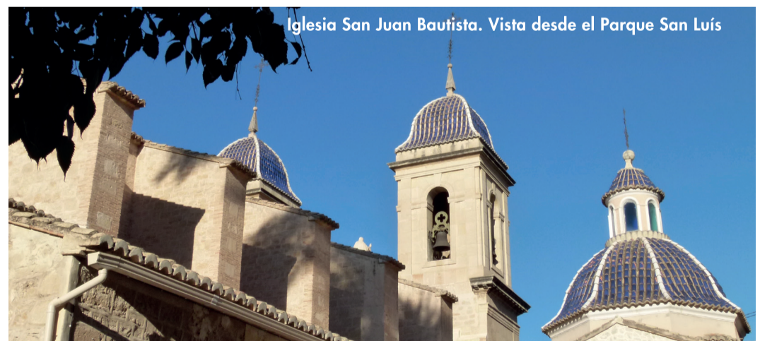
Iglesia San Juan Bautista. Vista desde el Parque San Luis