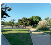
Parque Lo Pagán