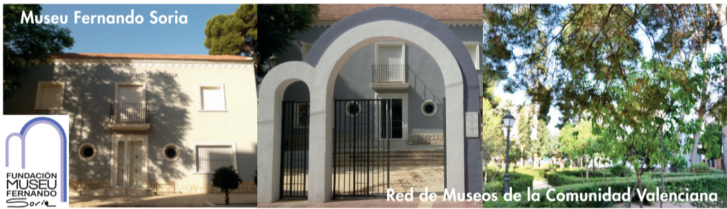
Museu Fernando Soria

Descubrir Sant Joan d'Alacant es dejarse seducir por una tierra llena de historia. Desde tiempos inmemoriales esta fértil comarca se ha dedicado a la actividad agraria. Durante los siglos XVI, XVII y XVIII nuestra prosperidad favoreció la construcción de importantes casas de labranza típicas de la Huerta, junto a una impresionante red de senderos, acequias y un conjunto de torres defensivas conocido como "Las Torres de la Huerta". En el siglo XIX, aristócratas y burgueses de la capital alicantina construyeron las mejores fincas como signo de poder y riqueza, buscando la paz y deleite en los campos de Alicante, dando origen a lo que hoy llamamos "veraneo". Si quieres saber qué empujó a los nobles a disfrutar aquí de sus días de asueto, adéntrate en nuestro pueblo y descubre el maravilloso legado que hemos atesorado a lo largo de los siglos.