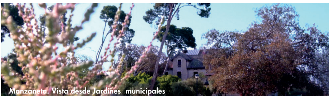
Manzaneta. Vista desde Jardines municipales

Descobrir Sant Joan d'Alacant és deixar-se seduir per una terra plena d'història. Des de temps immemorials esta fèrtil comarca s'ha dedicat a l'activitat agrària. Durant els segles XVI, XVII i XVIII la nostra prosperitat va afavorir la construcció d'importants cases de llauradors típiques de l'horta al costat d'una impressionant xarxa de sendes, sèquies i un conjunt de torres defensives conegudes com les "Torres de l'Horta". En el segle XIX, aristòcrates i burgesos de la capital alacantina van construir les millors finques com a signe de poder i riquesa, buscant la pau i delit als camps d'Alacant, donant origen al que hui anomenem "estiuieg". Si vols saber que va animar als nobles a gaudir ací dels seus dies de descans, endinsa't en el nostre poble i descobreix el meravellós llegat que hem atesorat al llarg dels segles.