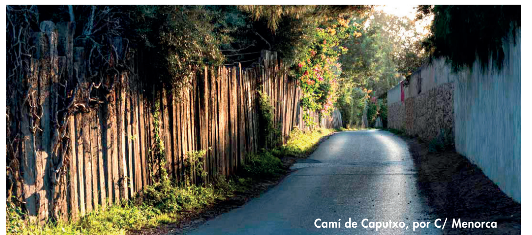
Camí de Caputxo, por C/ Menorca